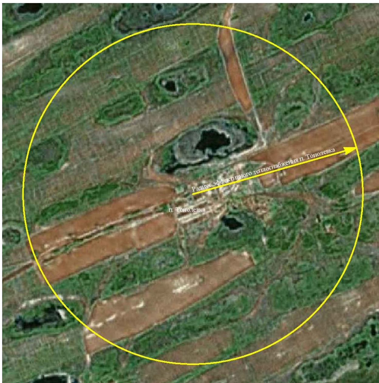
Рисунок 2.1 – Радиус эффективного теплоснабжения п. Тополевка

На основании полученных данных можно сделать вывод, что существующая жилая и социально-административная застройка п. Тополевка полностью находится в пределах радиуса эффективного теплоснабжения, и подключение новых потребителей в границах сложившейся застройки экономически оправдано.